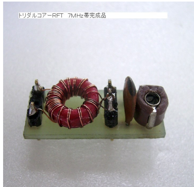
トロイダルコア-RFT 7MHz帯完成品